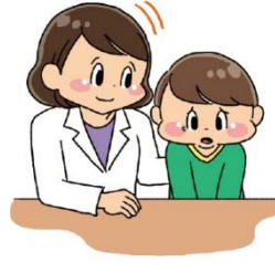
そうだん 相談ごとを話す