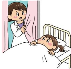
たいちようふりようじ きゆうよう 体調不良時の休養